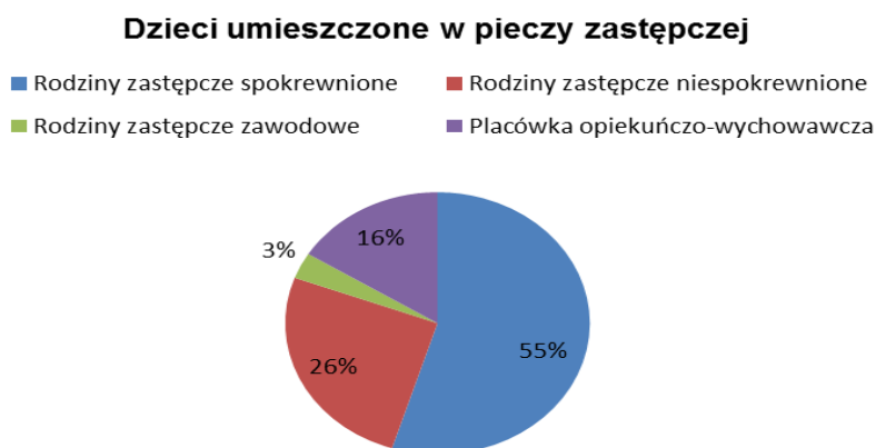
Wykres 8. Zestawienie ze względu na rodzaj pieczy zastępczej w Gminnym Ośrodku Pomocy Społecznej w Siechnicach w 2020 roku